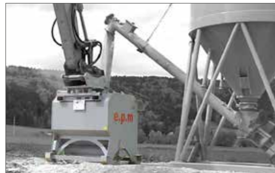
Befüllen mit Förderschnecke