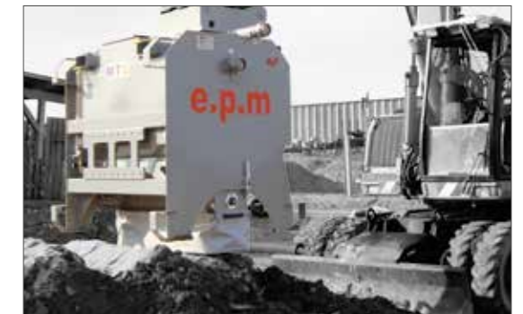
Bindemittel dosiert austreuen