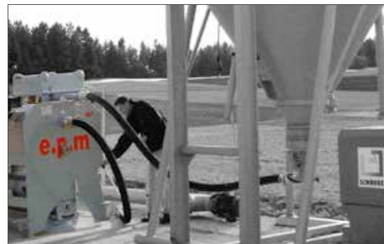
Befüllen mit Druckluft

Die Bilanz: bis zu 65 Prozent Kostenersparnis