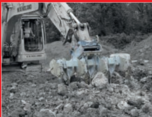
Kalk in den Boden einarbeiten