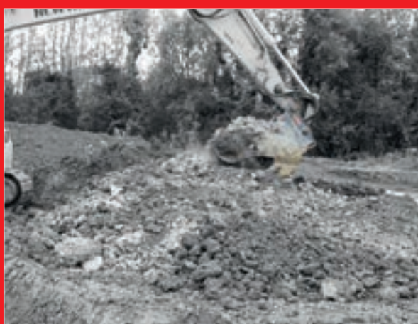
Weitere Arbeiten vornehmen