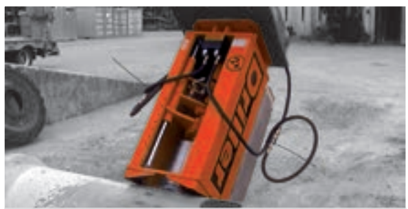
Herstellung eines Rohranschlusses

Kernbohr-Technik für Tief-, Straßen- und Kanalbauarbeiten: Das DRILLER-Bohrgerät für Bagger und Radlader bringt eine bis zu dreimal höhere Leistung als manuell ausgeführte Bohrungen. Die ausgereifte Technologie erlaubt sicheres, abgasfreies und präzises Bohren auf allen Ebenen und ist einfach zu handhaben.